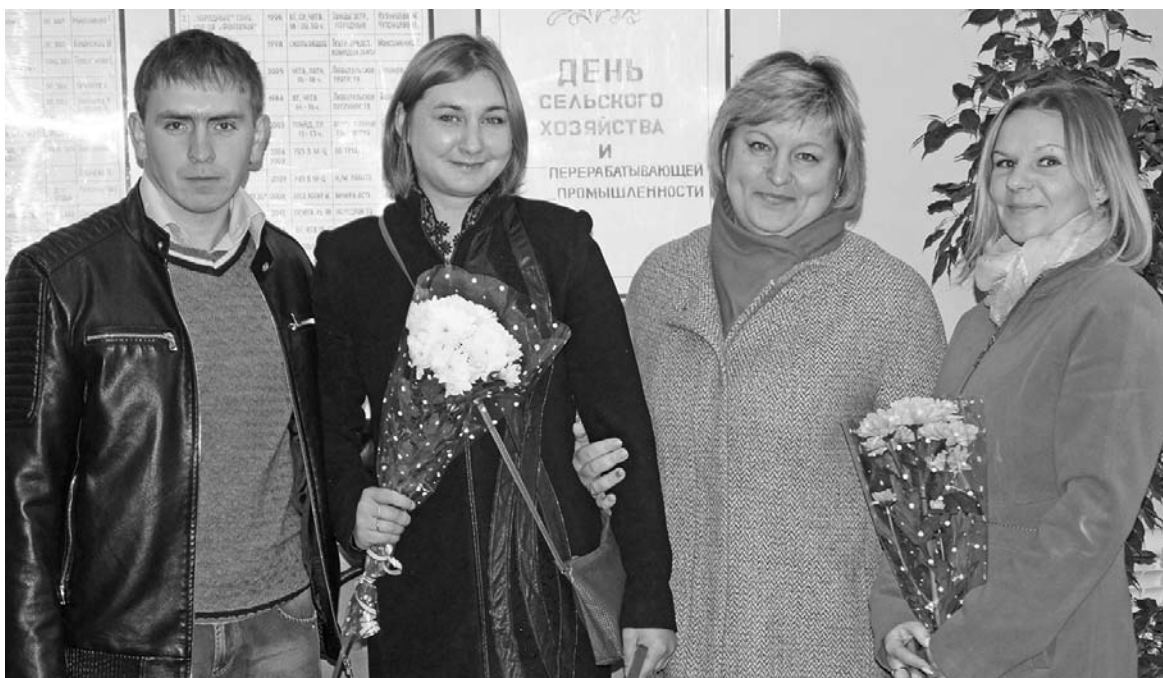
Делегация агрофирмы «Кадви».