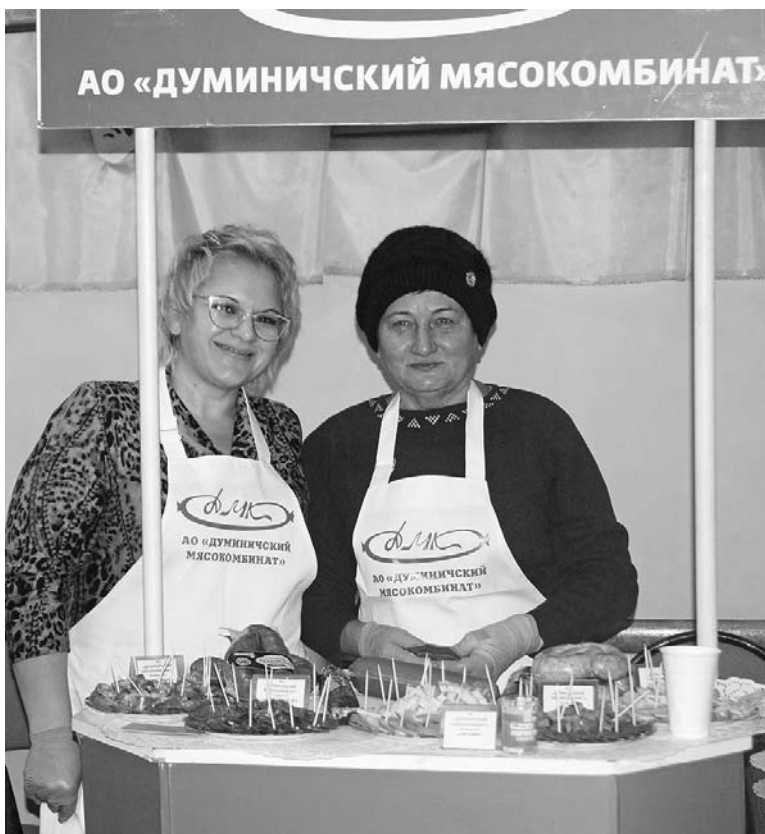
Работники мясокомбината представили вкусные новинки.