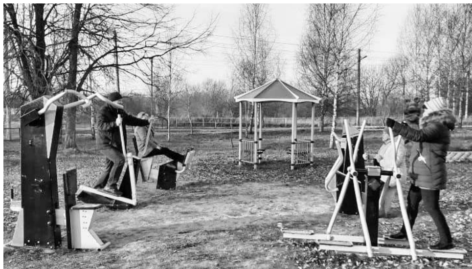
Уличные тренажеры в деревне Думиничи пользуются популярностью.