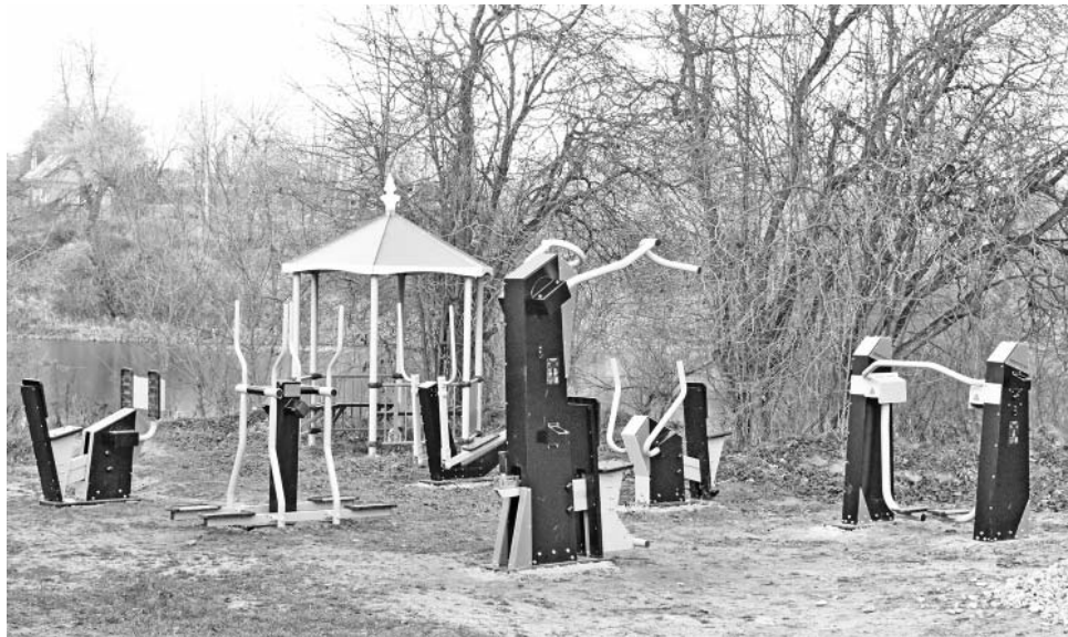
Тренажерная площадка в селе Вертное.

В этом году в двух сельских поселениях Думиничского района благодаря программе поддержки местных инициатив появились уличные тренажерные комплексы.